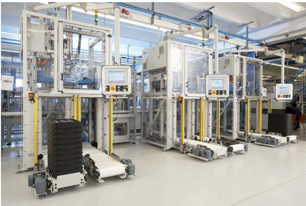
Cp9 Palettierer im Einsatz